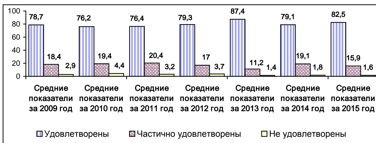
Диаграмма 1 – Динамика общей удовлетворённости родителей, %

Как менялись показатели степени удовлетворённости родителей качеством дошкольного образования в течение 2009-2015 гг., показано на диаграмме 1.